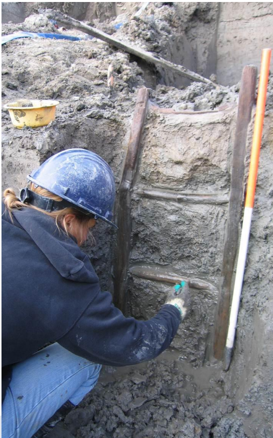
Foto: Hoewel hout in het veld zichtbaar is, zoals de hier gefotografeerde Romeinse ladder van ten minste 110 cm lengte, is een microscoop nodig om te achterhalen uit welke houtsoorten deze bestaat.

Als het specialistisch onderzoek plaats vindt in het kader van een groter archeologisch onderzoek, dan koppelt de opdrachtnemer de resultaten van het specialistisch onderzoek aan het archeologisch rapport.