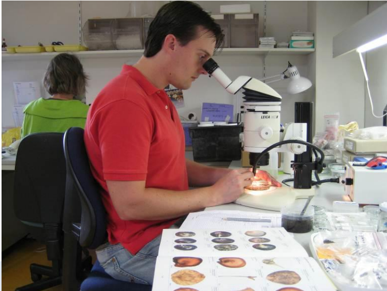
Foto: Opvallend-lichtmicroscop met vergroting tot 50x, een lichtbron met koud licht en flexibele lichtpunten, voor analyse van botanische macroresten.

Als op basis van het onderzoek de conclusie kan worden getrokken dat er behoudenswaardige archeologische vondsten aanwezig zijn in de bodem van het desbetreffende terrein, kan het de gemeente aan de vergunning het voorschrift verbinden dat opgravingen moeten worden uitgevoerd. Aan de vergunning kan ook het voorschrift worden verbonden dat ter behoud van de archeologische vondsten in situ technische maatregelen moeten worden getroffen. Tot slot kan het bevoegd gezag Wabo aan de vergunning een voorschrift verbinden ten aanzien van de vereiste archeologische maatregelen.